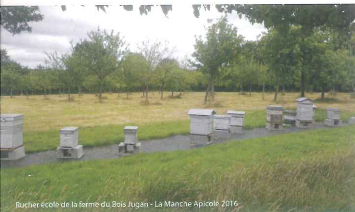
Rucher école de la ferme du Bois Jugan - La Manche Apicole 2016

Les opérations de destruction, dans le cadre de ce programme, peuvent être déclenchées à condition que la collectivité ait signé la convention de lutte collective et qu'elle participe au financement du programme.